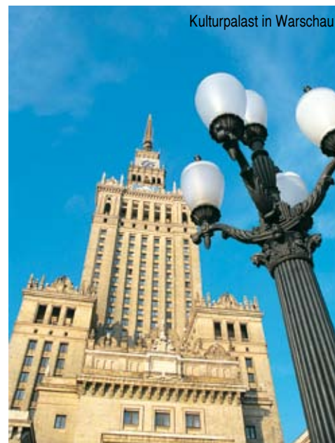
Kulturpalast in Warschau