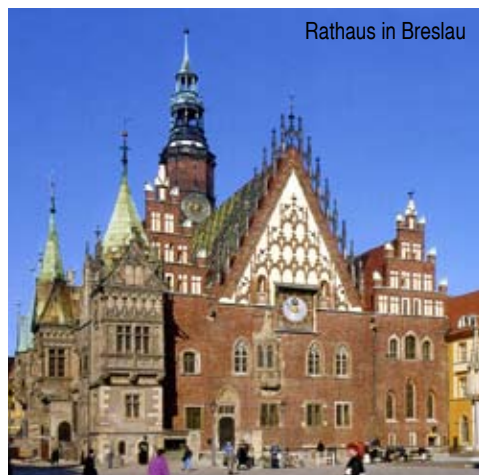
Rathaus in Breslau