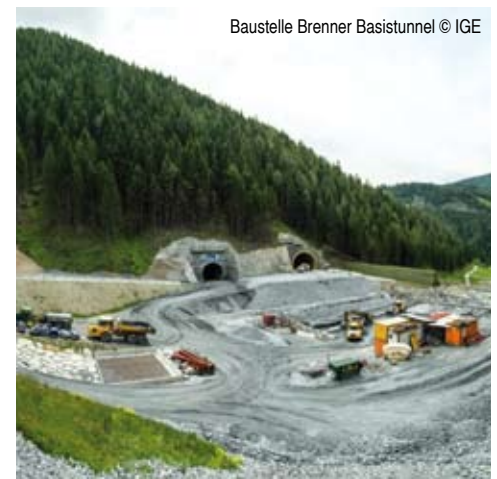
Baustelle Brenner Basistunnel